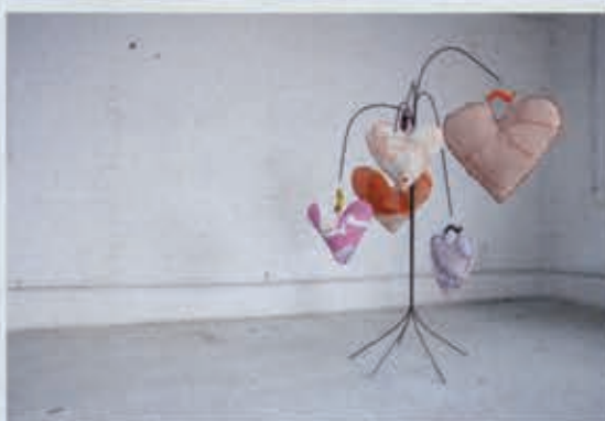
▲ EX VOTO 3, 220X150X150, 2012