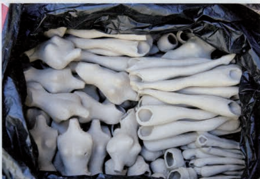
▲ GEGOTEN BARBIE ONDERDELEN, WARE GROOTTE, 2009