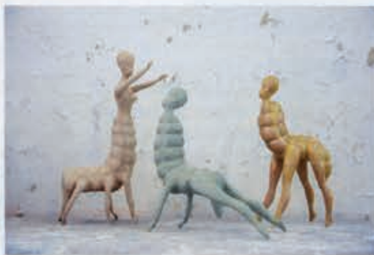
▲ WANDELEN DARMEN, 25CM HOOG, 2009

“Een eerbetoon aan mijn stoma. Wat moet ik zonder?”